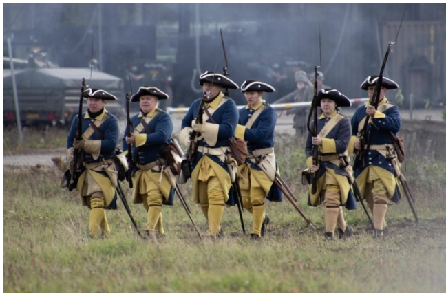
Tre soldater och Svenska Lif Compagniet