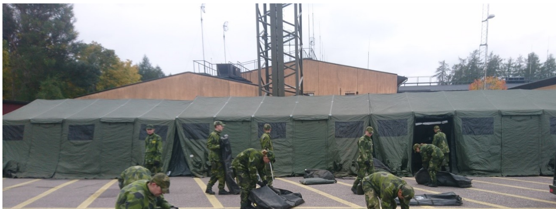
Tälten var resta, hopmonterade och flyttade.

På tisdagen restes de emotsedda tälten. En pluton värnpliktiga skötte resning. När tältens form kunde överblickas togs beslut att sätta ihop de tre tälten på längden till ett tält. Tyvärr så stod ett reservkraftverk i vägen vilket inte hindrade resningen av tälten. När reservkraftverket äntligen flyttats beordrades plutonen att dela upp sig på varsin sida om tälten. Med kommandot ett, två lyft lyfte alla samtidigt och tälten bars fram till sin slutliga plats. Som gammal signalist blev man imponerad. En kvinnlig värnpliktig uttryckte hur tråkigt det var att resa och flytta tält. Det visade sig att tälten var mycket bra och att de stora B0 skyltarna passade in perfekt mellan stolparna.