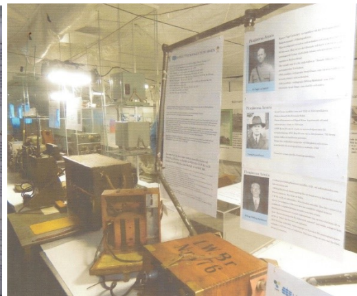
Allt var uppställt till fredagsvällen