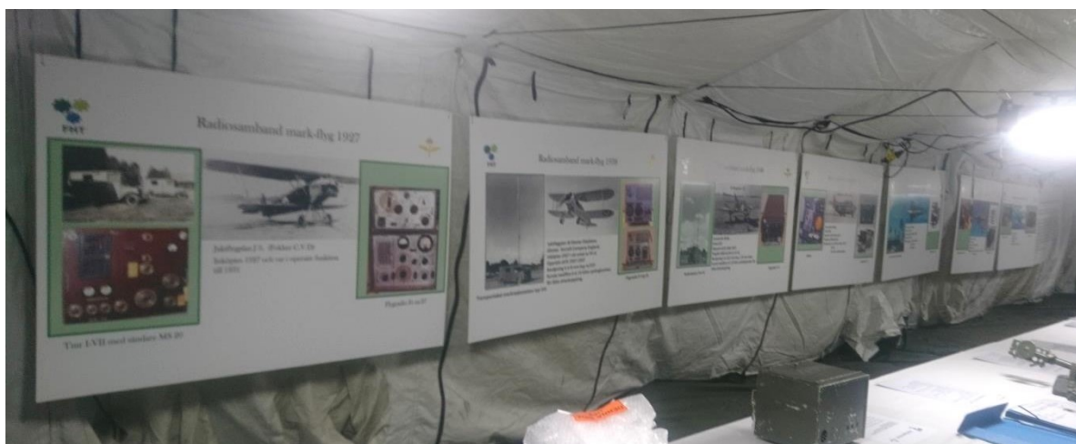
Planscherna passade in perfekt mellan tältens sektioner.