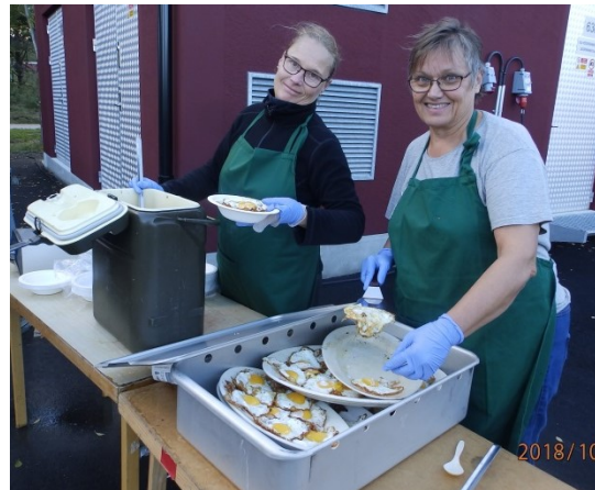
Koktrossen som lagar Pytt i panna åt oss