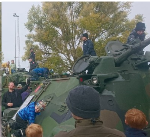
Radiostation Tmr-IX konkurrerade med stridsvagnen i popularitet hos dom yngsta.